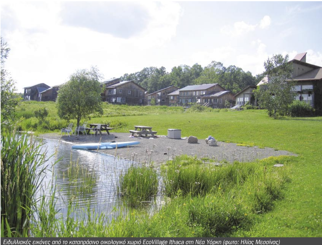
Ειδυλλιακές εικόνες από το καταπράσινο οικολογικό χωριό EcoVillage Ithaca στη Νέα Υόρκη

Μπορεί μια οικολογική κοινότητα να ακούγεται σαν ουτοπία, όμως αφορά στην σύγχρονη πραγματικότητα. Την πραγματικότητα που καθορίζεται σήμερα από τις κλιματικές αλλαγές και μας αναγκάζει να αναζητήσουμε λύσεις διαφορετικές από αυτές που έχουμε συνθίσει μέχρι σήμερα. Είτε ζούμε στην καταπράσινη Ithaca, είτε στην σκληρή έρημο του Νέγκεβ, είτε στην όμορφη Αίγινα, οι κοινότητες μπορούν και πρέπει να επηρεάσουν θετικά το μέλλον τους. ❄